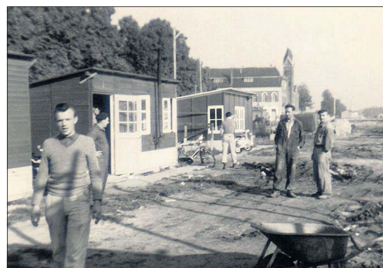
Werknemers van SvM aan het werk in Heibloem (1961).